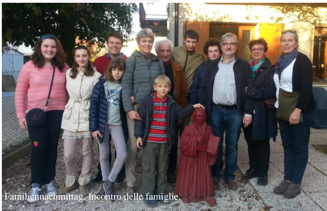
Familiennachmittag. Incontro delle famiglie.

Chi non ha mai avuto il desiderio di avere una visione generale della Bibbia e chiedere se la donna è davvero originata da una costola dell'uomo e se gli Evangelisti conoscevano Gesù di persona? Si può chiedere tutto in un piccolo corso sulla Bibbia nel periodo della Quaresima. A partire dal 9 febbraio fino alla Pasqua ogni martedì alle 17 nella sacrestia della chiesa ci si informerà e si discuterà. Il corso costa 20 euro (compreso il libro Die Bibel elementar ). Per partecipare è necessaria la preparazione di alcuni testi.