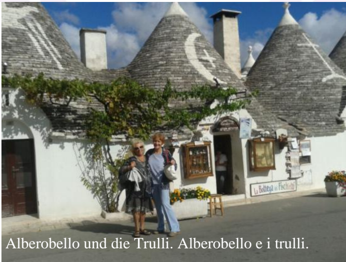
Alberobello und die Trulli. Alberobello e i trulli.