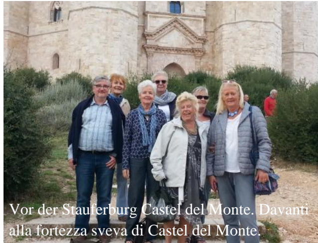
Vor der Stauferburg Castel del Monte. Davanti alla fortezza sveva di Castel del Monte.

Am letzten Abend fuhren wir nach Bari, das eigentliche Hauptziel. Auch das war ein Abenteuer! Im Feierabendverkehr mit einem Minibus voller besserwissender Frauen in diesem Zentrum eine Straße zu finden, wovon es in der Umgebung mehrere gibt, war keineswegs einfach. Der Pastor, der während der Fahrt das Amt vom Busfahrer übernahm, hat hier seine Geduld und Toleranz zum Äußersten austesten können. Und mit