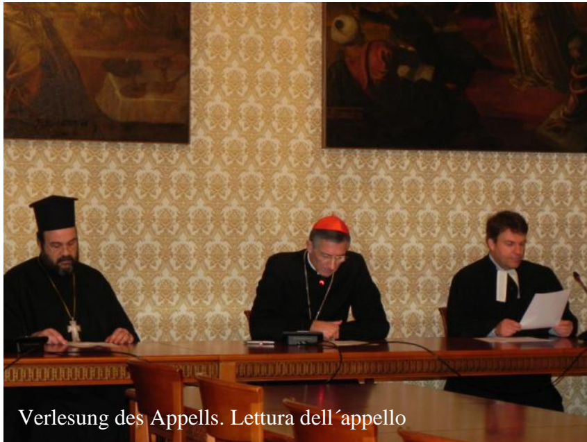
Verlesung des Appells. Lettura dell'appello

Geschichte. Aus diesem Grund schlagen wir einen Runden Tisch der Begegnung und des Dialogs vor.