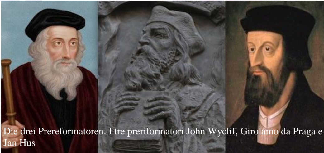
Die drei Prereformatoren. I tre preriformatori John Wyclif, Girolamo da Praga e Jan Hus