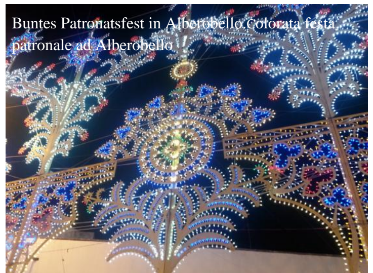
Buntes Patronatsfest in Alberobello. Colorata festa patronale ad Alberobello!