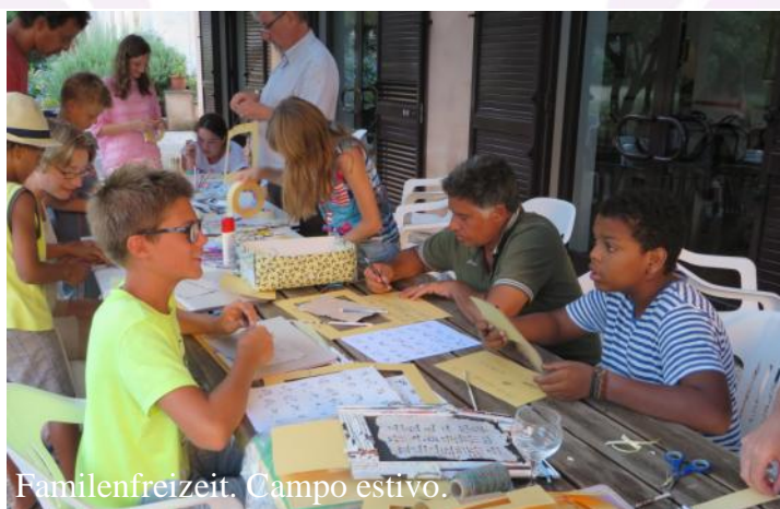
Familienfreizeit. Campo estivo.