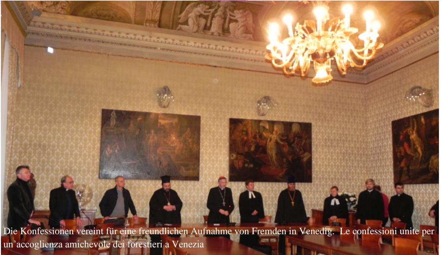
Die Konfessionen vereint für eine freundlichen Aufnahme von Fremden in Venedig. Le confessioni unite per un'accoglienza amichevole dei forestieri a Venezia