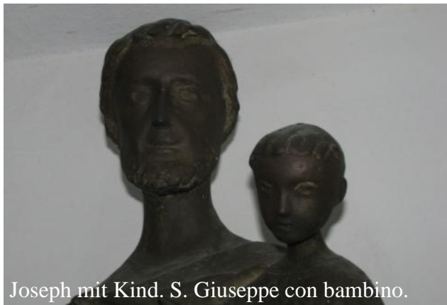
Joseph mit Kind. S. Giuseppe con bambino.

Gottesdienst, ein Teil übrigens Katholiken aus konfessionsverschiedenen Ehen. Statt weiteren Angeboten im Gemeindehaus gibt es einen Aperitivo nach dem Gottesdienst in einer Bar, Pilgerangebote zu den Klöstern der Umgebung, Kirchenerkundung oder auch Exkursionen zur ältesten lutherischen Gemeinde Italiens nach Venedig. Neben Kurgästen kommen auch immer Gemeindeglieder in den Gottesdienst. Das bayrische Gesangbuch wurde durch ein deutsch-italienisches ersetzt. Auch einige Italiener sind anwesend, für sie gibt es auch eine Zusammenfassung der Predigt auf Italienisch. Inzwischen wird in der Thermalzone jedoch mehr von Wellness statt von Kur gesprochen, um jüngeres und kulturinteressiertes Publikum anzuziehen. Denn Abano Terme liegt strategisch günstig zwischen den Euganeischen Hügeln, die zu kulinarischen, enogastronomischen und anderen Erkundungen einladen, und Städten, die äußerst attraktiv sind. Veränderungen werden weitergehen. Balsam für die Seele ist weiterhin