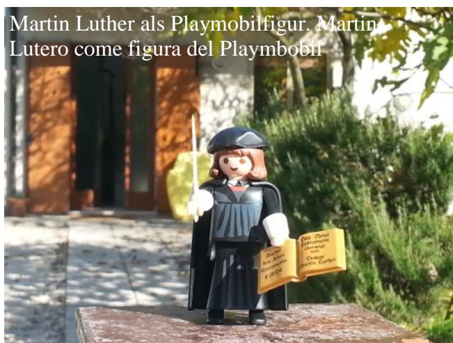
Martin Luther als Playmobilfigur. Martin Lutero come figura del Playmobil

Dopo la pausa per le ferie estive inizierà un nuovo corso per i confermandi, per bambini e ragazzi che hanno circa 12 o 13 anni. Il corso durerà fino alla primavera e si concluderà con la Confermazione nella primavera del 2017. Verranno trattati dei temi centrali della fede, della Bibbia e della Chiesa, che dovrebbero stimolare i confermandi a confrontarsi; il corso vuole trasmettere la gioia di essere cristiani.