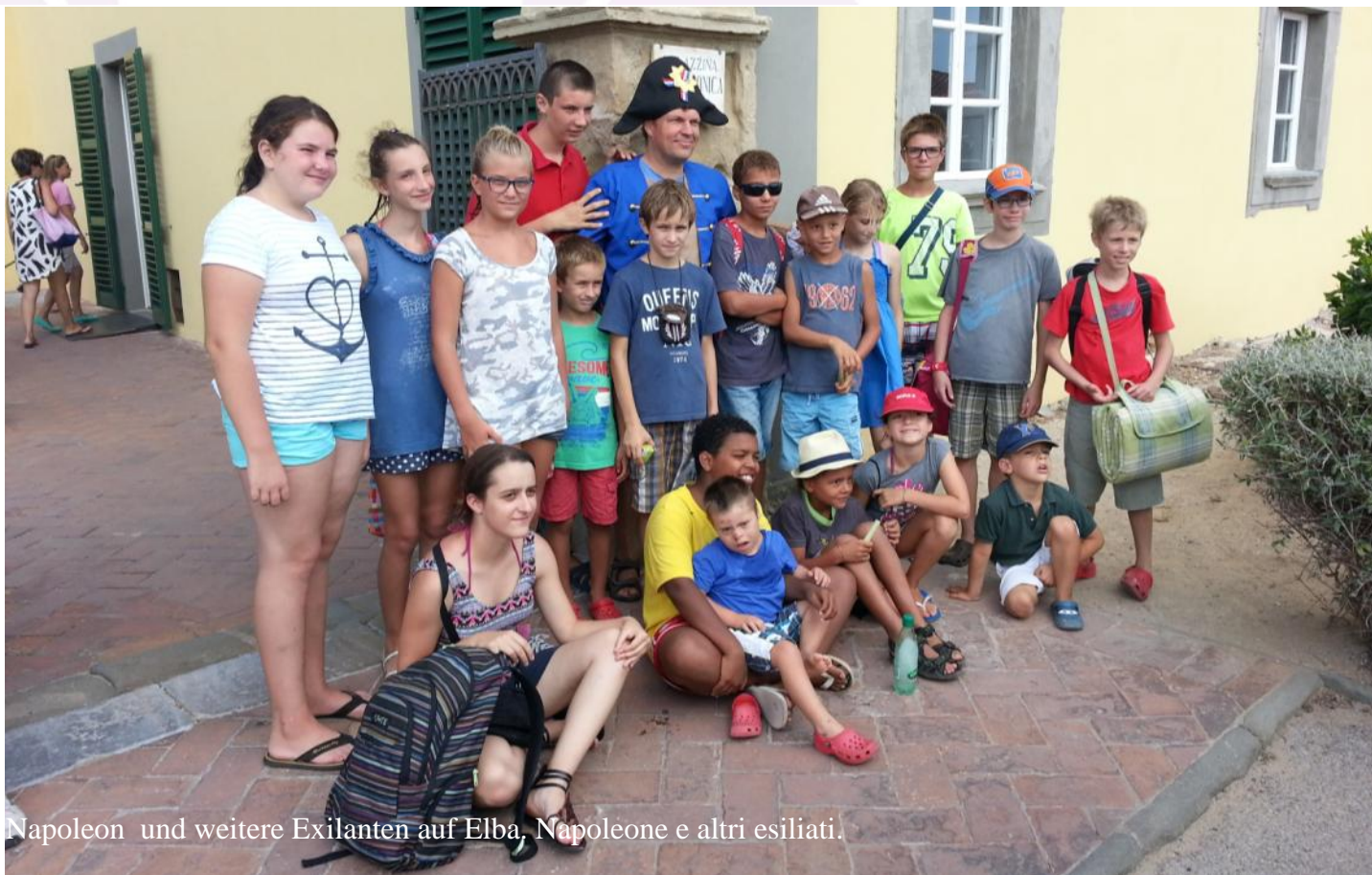
Napoleon und weitere Exilanten auf Elba, Napoleone e altri esiliati.