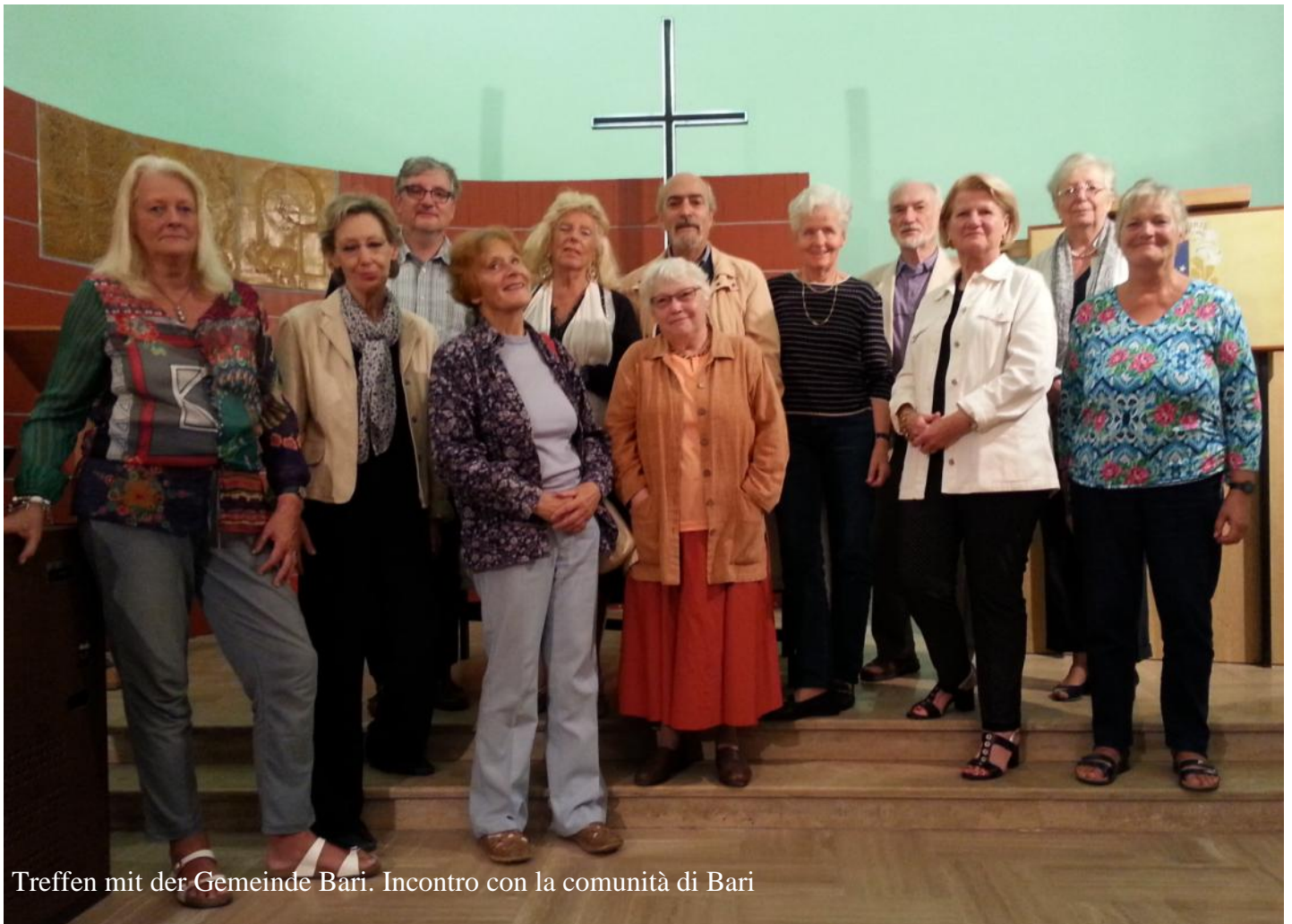
Treffen mit der Gemeinde Bari. Incontro con la comunità di Bari

wurde einer anderen Fluggesellschaft überlassen und damit schon gleich ein abenteuerlicher Akzent gesetzt, der die Reise prägen sollte. Angekommen an unserem Bestimmungsort fanden wir den reservierten Minibus für neun Personen (wir waren zu acht) auf dem